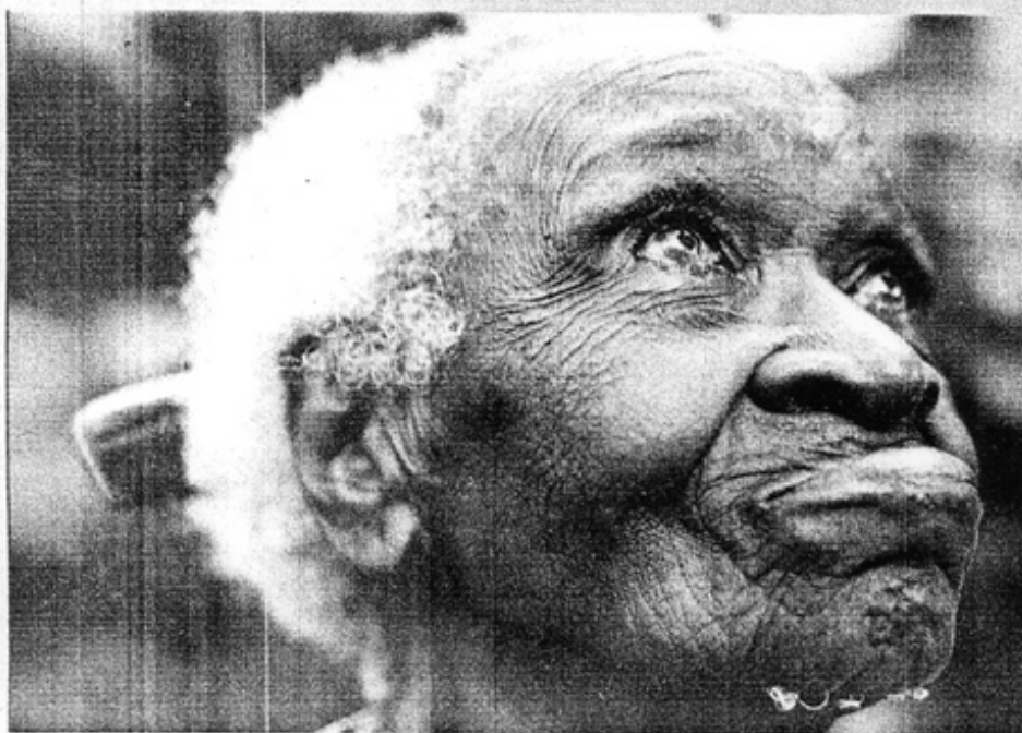
HISTORIAS DE MUJERES / NICOLAS VILLAUROME

Primero hacemos muestras en las ciudades para que la gente que no conoce, se de cuenta de la riqueza que existe al interior de sus propias geografías, riqueza que no hay que olvidar sino más bien resguardar; porque en un mundo de globalización económica lo que viene después es un mundo de homogeneización cultural, y cuando no hay una identificación de todas las personas para con sus colectivos, tradiciones, lenguas o historia, resulta difícil plantear una lucha democrática contra cualquier avasallamiento foráneo. Esa es la razón por la cual exhibimos la muestra en las ciudades. Lo segundo y tal vez lo más importante es que todo esto, de alguna manera, regresa hasta las comunidades. ¿Cómo? Antes de montar la exhibición urbana, he vuelto a viajar por todas las localidades en las cuales he trabajado para entregar fotografías y grabaciones a aquellas personas que han participado conmigo. Al hacer esto me he dado cuenta de que en general ellos, al verse retratados pero también al escucharse, se complementan como una totalidad y logran identificarse y revalorizarse como integrantes de un grupo rico en elementos culturales. Ahora, no es mi intención cambiar la unidad o la vida de un pueblo o inclusive su propia estética. El