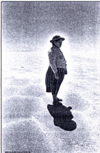
LOS DIABLITOS DEL SALAR: la mujer advierte de pequeñas criaturas malvadas que viven en el Salar de Uyuni y que es mejor evitarlos si no...