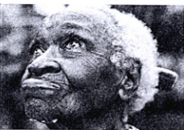
Historias de brujas... (Villa Rica, Colombia).