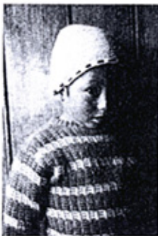
Los diablitos del salar (Salar de Uyuni, Bolivia).