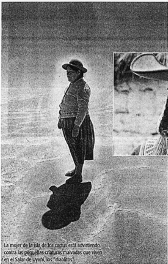
La mujer de la isla de los cactus está advirtiéndole contra las pequeñas criaturas malvadas que viven en el Salar de Uyuni, los "diablitos".

Esta anciana del sur de Colombia es una especialista en las historias fantásticas donde se producen los demonios, brujas y fantasmas conocidos de la región.