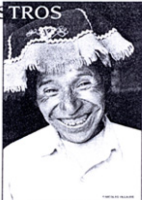
FABULAS EN VERSIÓN ANDINA: historias con moralidad para los niños, hablando de animales andinos. Poques