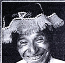
Poques-norte de Cusco.

ni), habla del diablito que cruza de Tunupa a Quinchá, pasando por Incahuasi. "Es de cabello medio rosado" y dientes impresionantes. "Había siempre diablito, ¿no ve? Hay pues, ¿no ve?", se le oye afirmar.