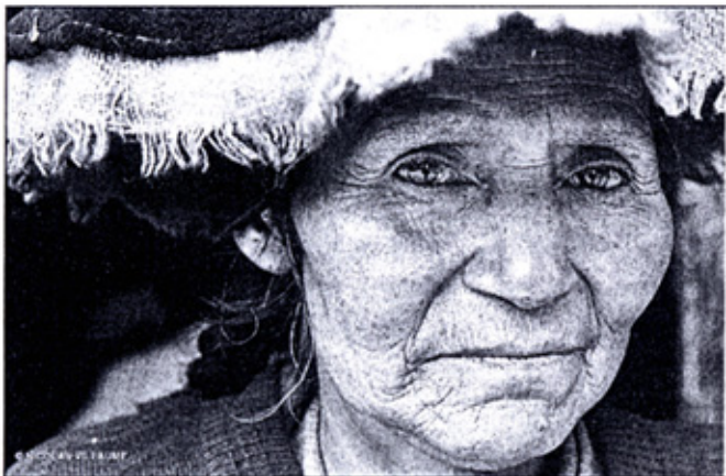
RELATOS DE LOS ANDES: continuación de los cuentos para niños narrados por una abuela de la comunidad Poques, de Cusco, Perú

"Será en la sede de la UNESCO y contará además con otros recursos técnicos como pantallas de plasma, montajes, entre otros".