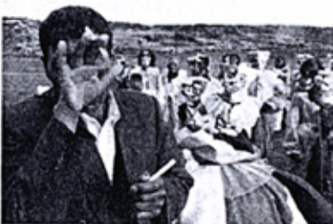
Los últimos diablos del carnaval (Achacachi, Bolivia).