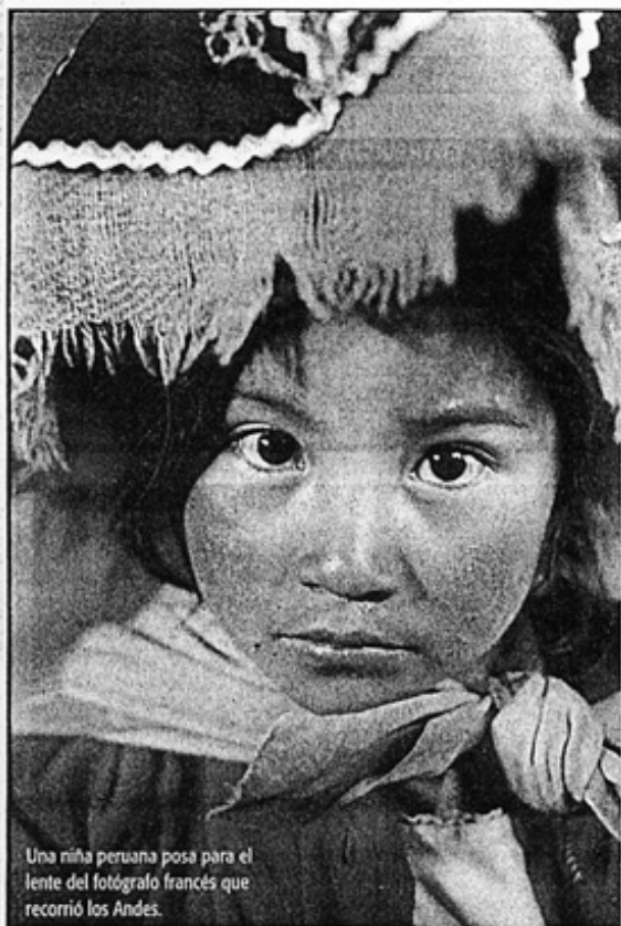
Una niña peruana posa para el lente del fotógrafo francés que recorrió los Andes.