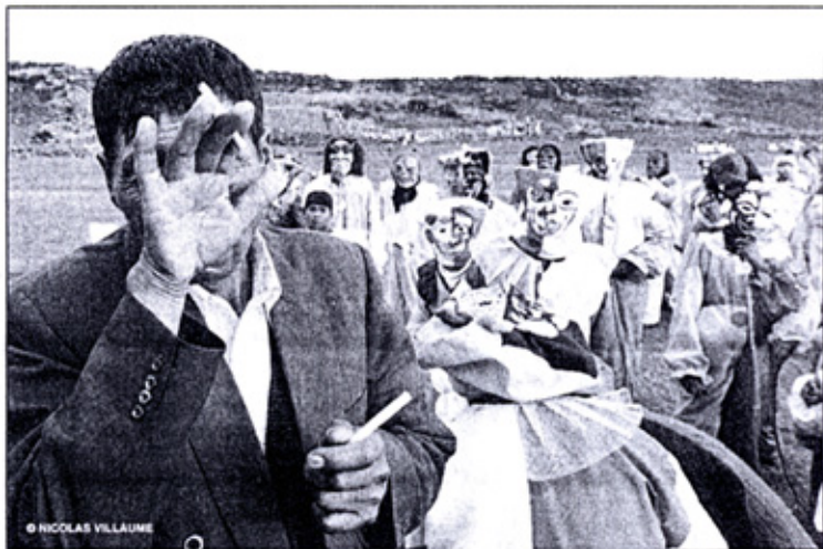
LOS ÚLTIMOS DÍAS DEL CARNAVAL: hundida en las canciones y el ambiente encubierto de los últimos días de carnaval del altiplano boliviano. Cerca a Achacachi, provincia Omasuyos, departamento de La Paz