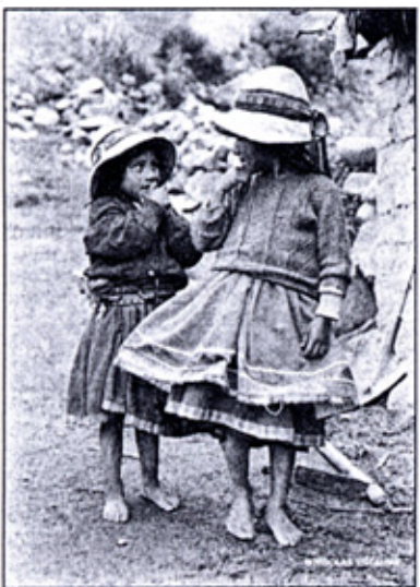
Villau retrata también a los niños andinos